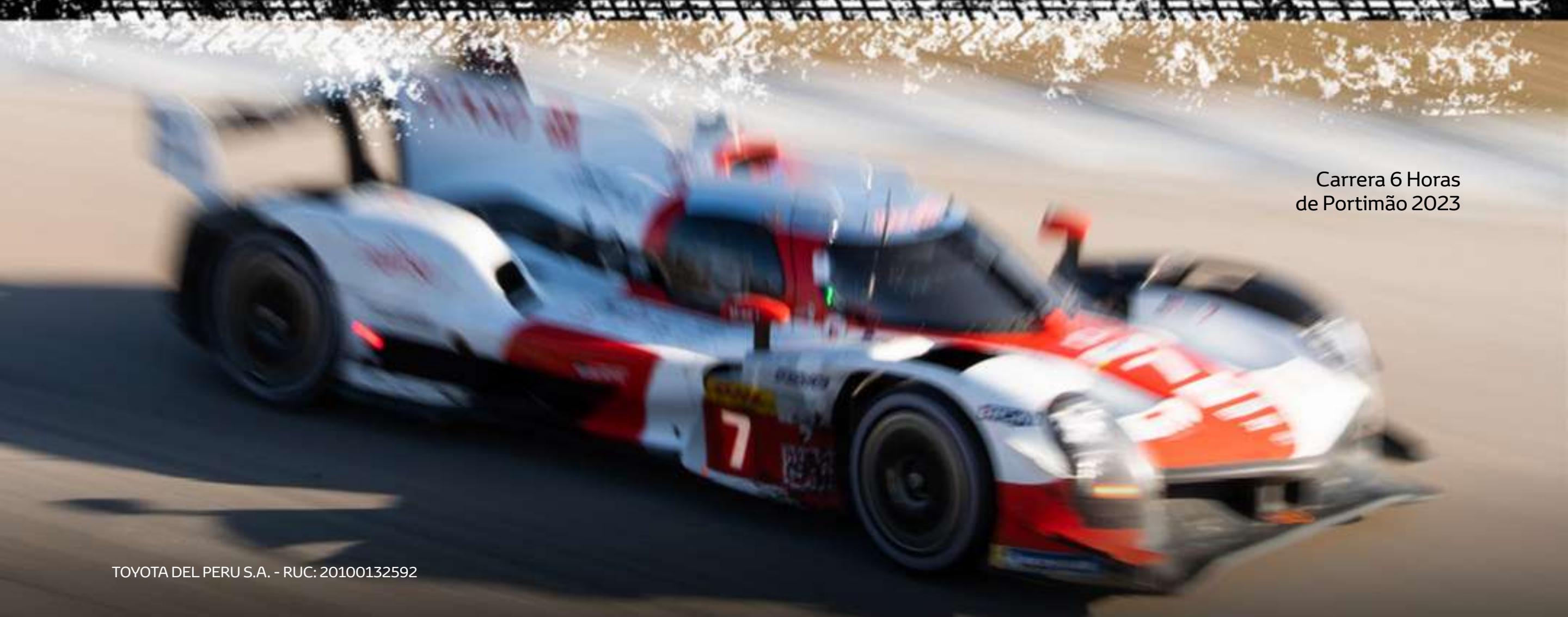
Carrera 6 Horas de Portimão 2023