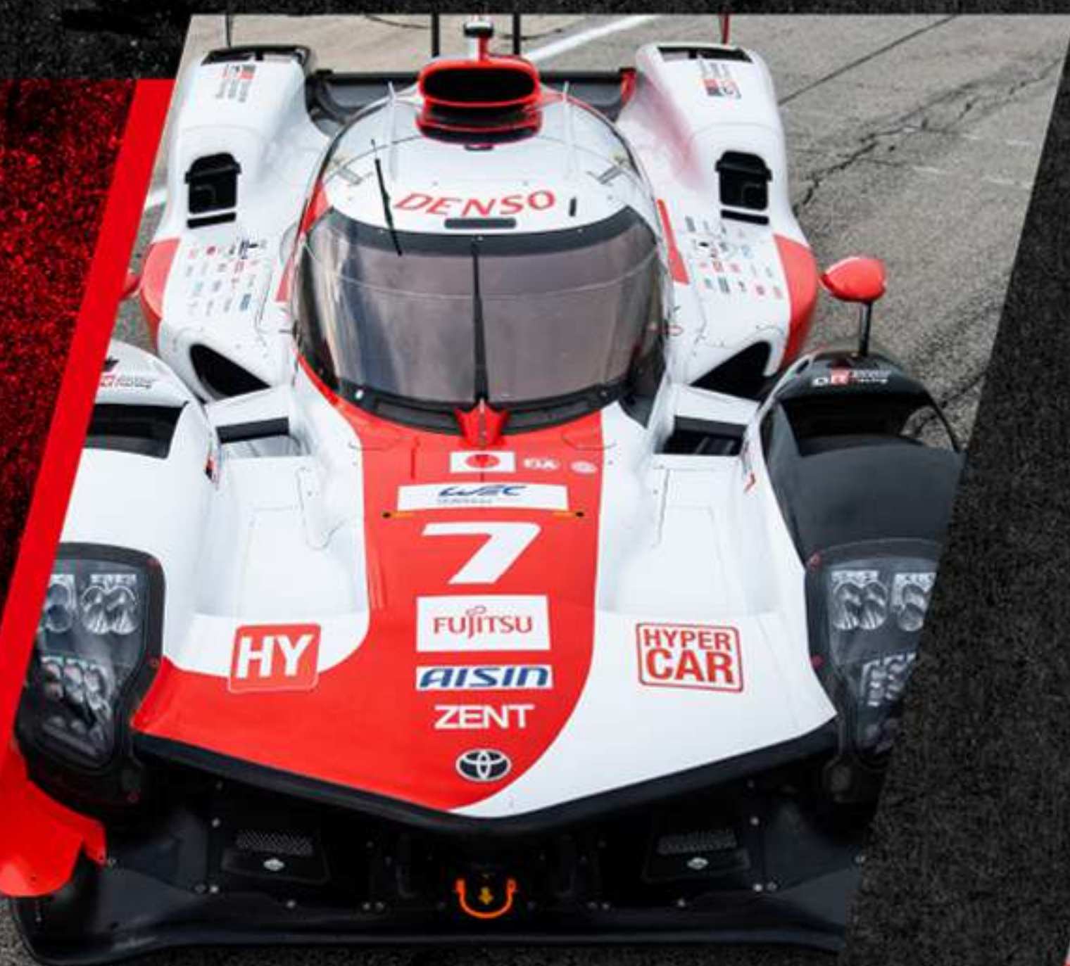
Carrera 1000 millas de Sebring 2023

El Campeonato Mundial de Resistencia es uno de los eventos más exigentes del mundo, que incluye las 24 horas de Le Mans, y ya lleva más de 9 años probando a diferentes conductores; por eso es una de las tres carreras clásicas del mundo del automovilismo. Sin embargo, con la fuerza y velocidad que caracteriza nuestro equipo, logramos tener un hat-trick en el 2018, 2019 y 2020.