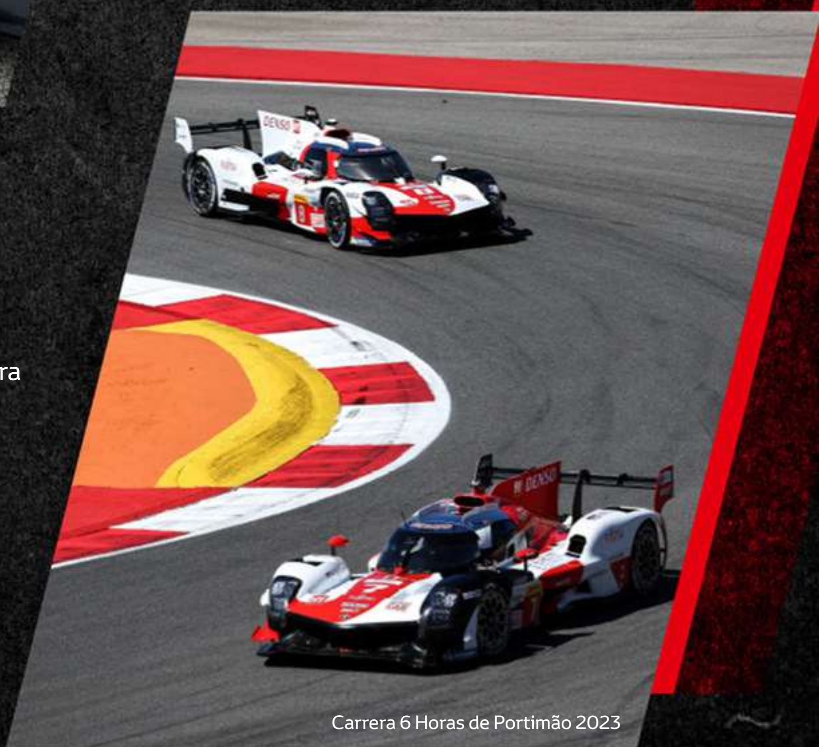
Carrera 6 Horas de Portimão 2023

Y esto es solo el comienzo, porque siempre seguiremos mejorando para cada nuevo desafío, buscando la máxima potencia y desempeño que será probada en caminos reales y servirá para inspirar los superdeportivos de la próxima generación. Ya que nuestra misión no es solo ganar carreras, sino crear autos que cautiven las futuras generaciones.